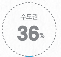
22년 신입 채용 비수도권 출신 인재

또한, 청년 일자리 창출을 위해 취업희망자가 공사의 다양한 업무를 경험할 수 있도록 130명의 체험형 인턴을 운영하고, 정부의 취업지원 프로그램인 일경험 프로그램을 활용하여 28명의 청년층에 직무체험의 기회를 제공했습니다. 앞으로도 채용 취약층이 새로운 기회를 가질 수 있도록 사회형평적 채용 확대를 포함한 공공기관으로서의 모범적 역할을 수행해 정부가 부여한 임무를 충실히 수행하면서도 국민이 행복한 사회를 만드는 데 일조하겠습니다.